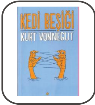
KEDİ BEŞİĞİ KURT VONNEGUT